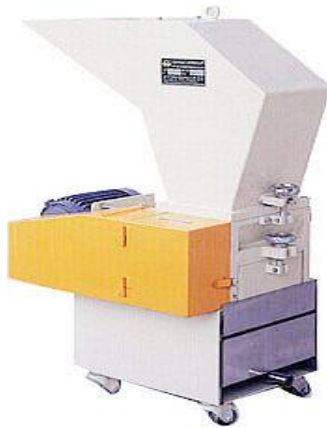
No. 1 – Molino Silencioso

Molino para pie de máquina Potencia: Desde 1HP hasta 5HP