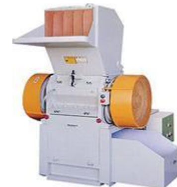
No.5 - Molino Universal