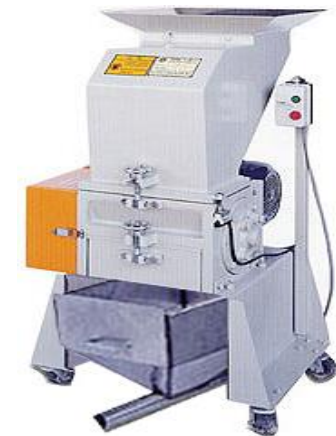
No. 2 – Molino Silencioso

Molino para pie de máquina Potencia: Desde 5HP hasta 100HP