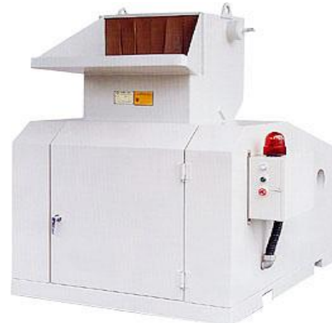
No.4 – Molino Silencioso