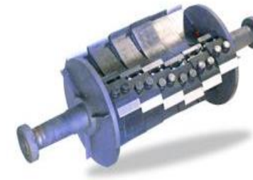
Rotor Cuchilla Tipo V 1

Los datos ofrecidos sirven como referencia, se definirán concretamente para cada caso.