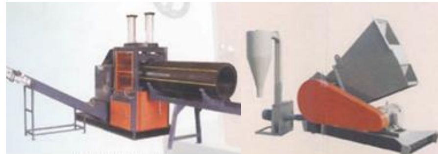
No. 6 – Triturador

Molino para pie de máquina Potencia: Desde 1HP hasta 5HP