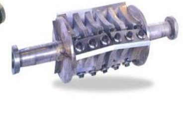
Rotor Cuchilla Tipo V 2