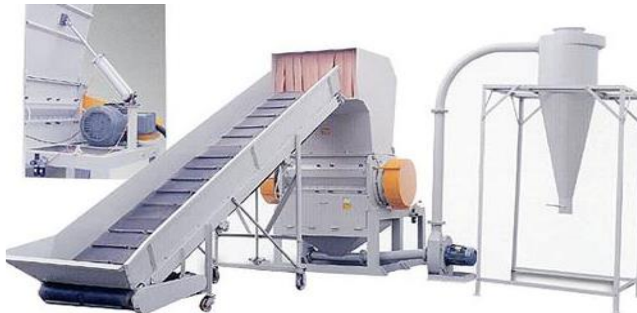
Molino Universal Potencial + Ciclón Separador